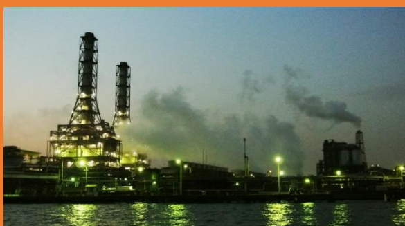
いま大人気の工場夜景ツアー