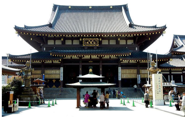
お正月には大勢の参拜客で賑わう川崎大師